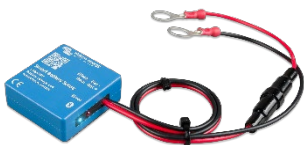
Detección de Bluetooth: Smart Battery Sense