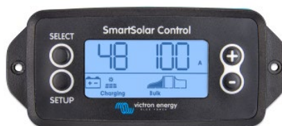
Pantalla enchufable SmartSolar